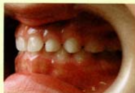
マウスピースで改善された正常な歯並び